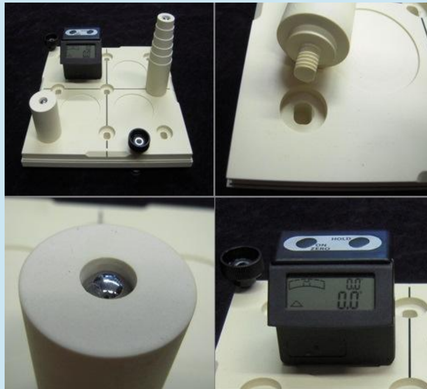
Grundplatte, Kugelträger, Digitale Wasserwaage

zu dem Schluss gekommen, das ein direkter Zusammenhang zwischen Positionierungsgenauigkeit der Bestrahlungsfelder und Abstand des Zielvolumen zum Isocenters besteht. Die Positionierungsgenauigkeit der Bestrahlungsfelder nimmt in der Regel ab, je weiter entfernt sich das Zielvolumen zum Isozentrum befindet. Der sogenannte „asymmetrische Winston-Lutz Test“ lässt sich mit dem SnookerCue Phantom mit hoher Präzision einfach durchführen um Ihre Positionierungsgenauigkeit zu ermitteln.